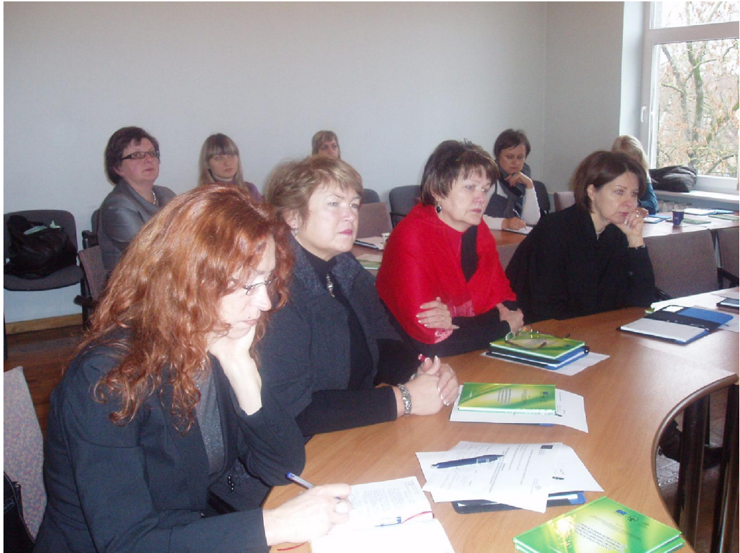
2010-11-22 d. seminaro Panevėžyje akimirkos